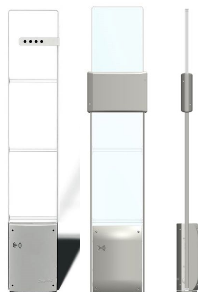
Con contapersone integrato (opzionale)

EVOLVE G35 è personalizzabile per adattarsi a qualsiasi ambiente, grazie al plexiglass e ai LED integrati - che possono essere impostati in modo permanente su on o accendersi solo quando l'antenna è allarmata - è perfetta per quei retailer che vogliono un design di alto livello senza sacrificare le prestazioni. Il contapersone integrabile consente ai retailer di acquisire in modo discreto e accurato il numero di visitatori che può essere caricato automaticamente su un servizio di reportistica a scelta. Il kit di aggiornamento RFID offre un'opzione conveniente per i retailer che vogliono trarre vantaggio dall'utilizzo della tecnologia RFID come EAS. La base dell'antenna può essere coordinata per adattarsi al meglio all'ambiente del punto vendita, rendendo il G35 una soluzione completamente personalizzabile*.